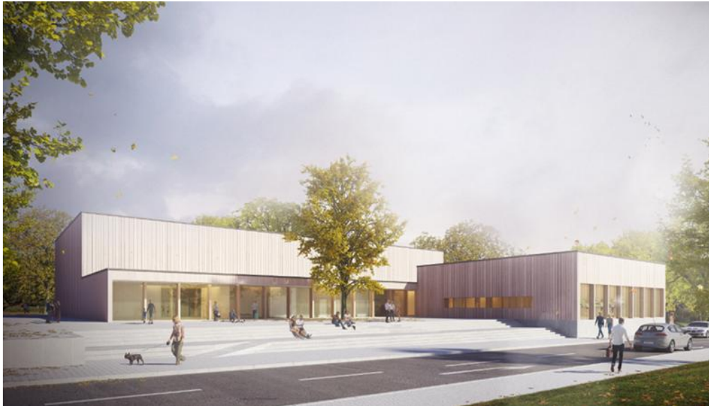
Ansicht Haupteingangsbereich von der Turnstraße

Die Größe des Kunstwerks soll sich in der Fläche auf das vorgesehenen Baufeld beschränken (siehe Anlage Lageplan Sporthalle mit Kennzeichnung Baufeld)