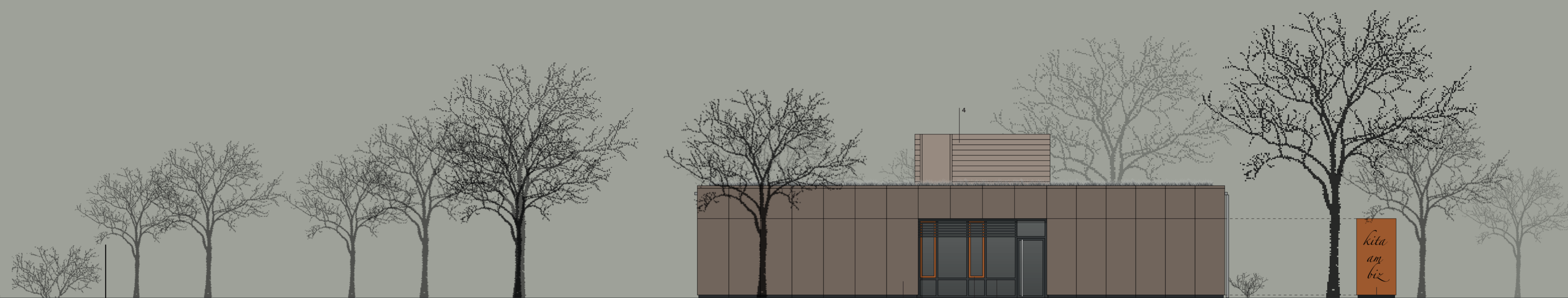
ansicht ost kita am biz | m = 1:100