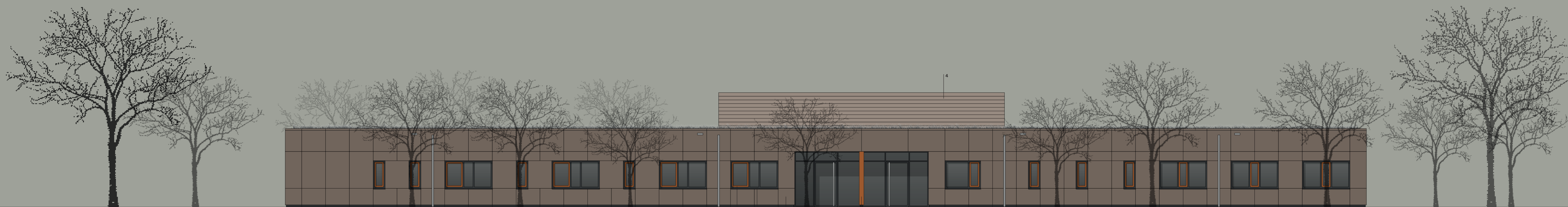
ansicht nord kita am biz | m = 1:100