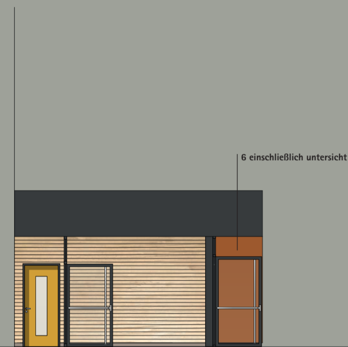
6 einschließlich untersicht